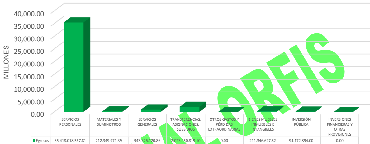
GRÁFICA 2 EGRESOS